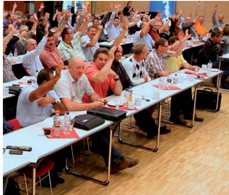
Die Tariff Kommission spricht sich für die Forderungen aus.

Und dort, wo Leiharbeiter zum Einsatz kommen, muss das auch für sie ohne Einschränkung gelten. „Gleiche Arbeit – Gleiches Geld“ diesen Grundsatz wollen wir künftig erstmals per Tarifvertrag sichern. Ansetzend an dem, was in einigen Unternehmen bereits durch Betriebsvereinbarungen festgeschrieben ist, geht es jetzt um einen allgemeinen Mindeststandard für die Branche. Eine Spaltung in besser und schlechter bezahlte Beschäftigte will niemand in der Tariff Kommission hinnehmen.